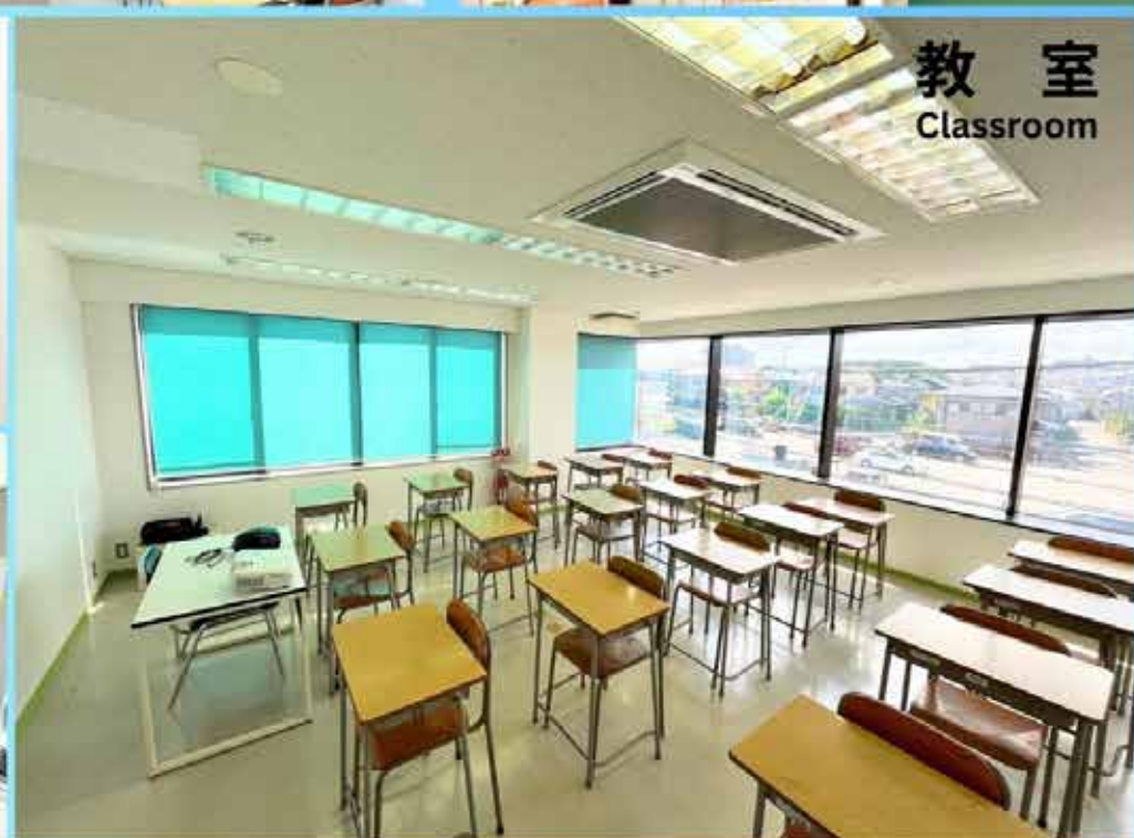
教 室 Classroom