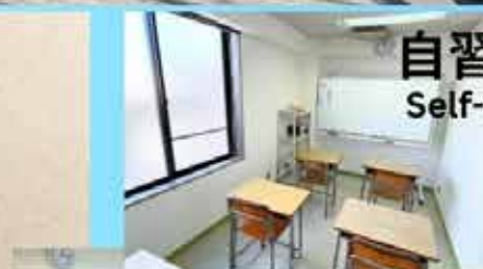
自習室 Self-study room