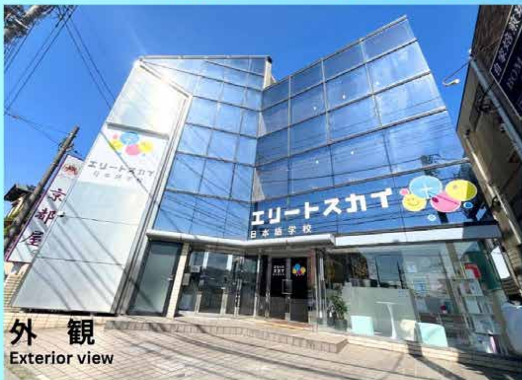
外 観 Exterior view