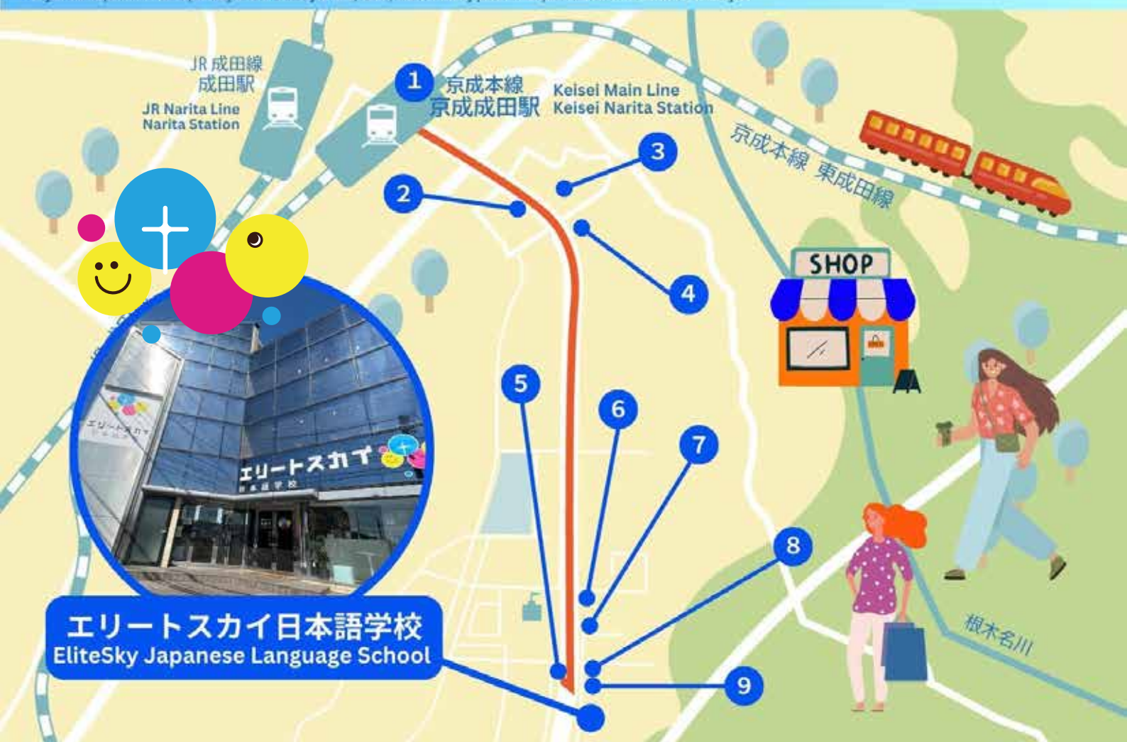
エリートスカイ日本語学校 EliteSky Japanese Language School

Our school is located in Tomisato City, which is rich in nature. The area around the school is a quiet environment suitable for learning. The nearest station to the school is Keisei Narita Station. This area is close to the airport and has good access, giving it an international atmosphere. You can enjoy the scenery of the four seasons, and the local festivals are fascinating. In addition, Narita is a town that has flourished for a long time and is dotted with historical sites. There are also plenty of shopping facilities and restaurants where you can enjoy local cuisine and products, so you can experience the Japan way of life. The city is safe, clean, well served by public transport and offers a convenient lifestyle.