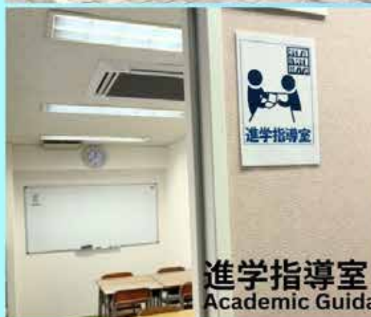
進学指導室 Academic Guidance Office